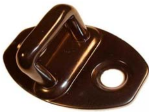
Teil einer PKW Türverriegelung

Diese von der Automobilindustrie an Hillebrand gestellte Herausforderung erforderte den Einsatz von neuartigen Oberflächen. Neben der hohen Korrosionsbeständigkeit sollte die Beschichtung einen hohen Widerstand gegen Verschleiß bieten. Die im täglichen Gebrauch auftretenden Beanspruchungen dürfen auf dem Objekt keine Gebrauchsspuren hinterlassen.